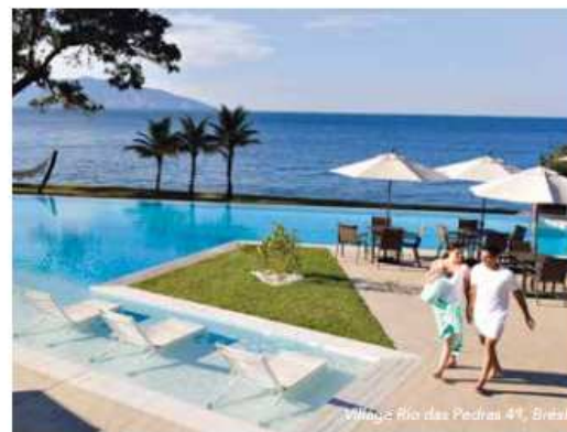
Village Rio das Pedras 4*, Brésil