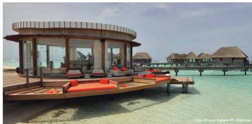
Kani 4 th avec Espace 5 th , Maldives