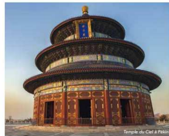
Temple du Ciel à Pékin

Après 4 jours au cœur de la capitale chinoise, place à 4 jours de détente au Village Guilin 4*. De la Cité Interdite jusqu'aux reliefs caractéristiques de Guilin, en passant par Jinshanling, portion confidentielle de la Grande Muraille, laissez-vous fasciner.