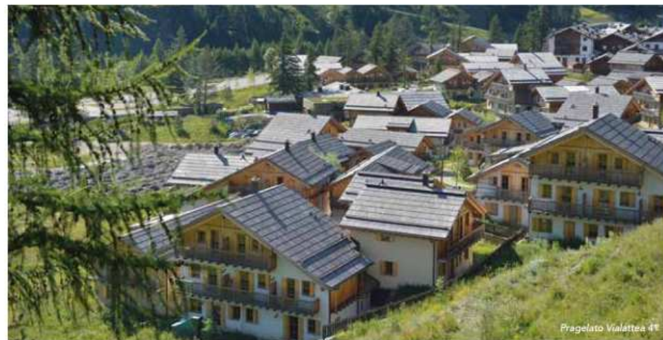
Pragelato Vialattea 41