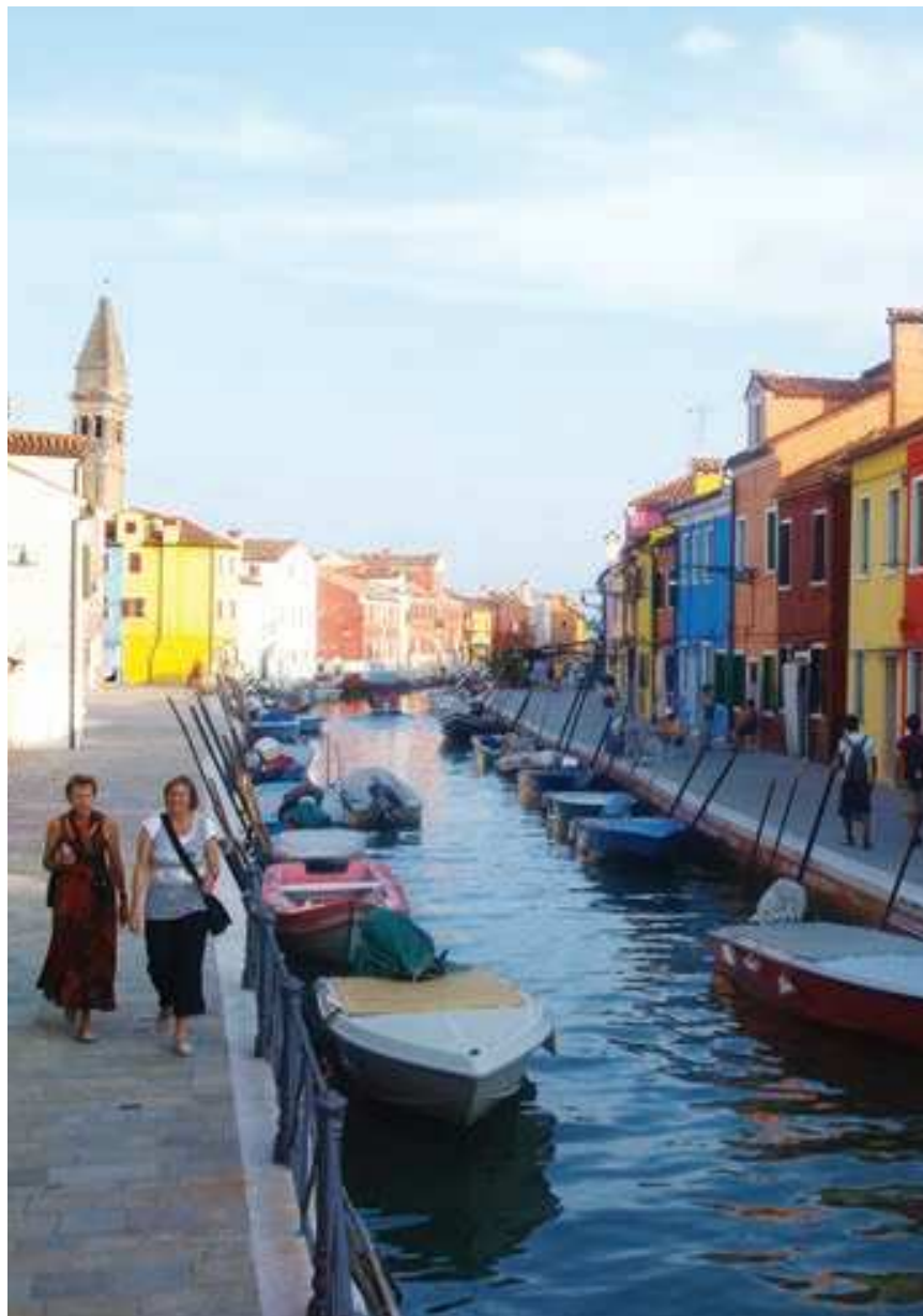
Promenade à Burano

Explorez le Nord de la lagune de Venise en direction de Trieste et découvrez le Coeur de l'Italie. Tout au long de votre croisière, profitez des stations balnéaires et de leurs plages de sable fin, des jolis ports de pêche, des excellents restaurants, et des nombreux Osterias (brasseries traditionnelles), loin du trafic vénitien.