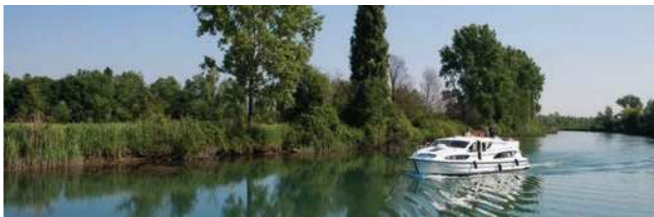
Rivière Stella, Preconico