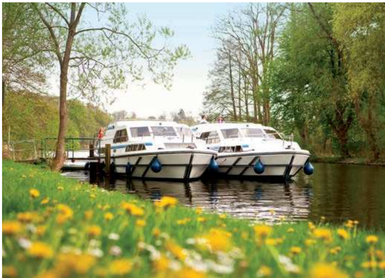
Le Schwarzer see, Reinsburg