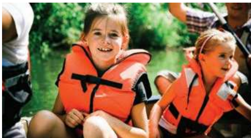
Canoe à Spreewald

Spreewald, extraordinaire réserve naturelle préservée, où se dissimulent, entre forêts et prairies, de ravissants petits villages.