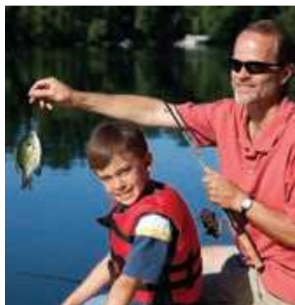
Pêche sur le lac Müritz

En partant de notre base de Marina Wolfsbruch, une superbe marina avec un centre de loisirs et de remise en forme, vous naviguerez dans la région du Mecklembourg, idéale pour la baignade, les sports nautiques et l'observation des oiseaux. Admirez les ravissants petit chalets colorés du bord de l'eau près des villages de Mirow, Rechlin, Robel, Klink, Plau et Waren. Baladez-vous dans leurs rues pavées aux maisons à colombages. Ne manquez pas la visite des impressionnants châteaux baroques de Schwerin, Rheinsberg, Furstenberg et Neustrelitz. Notre