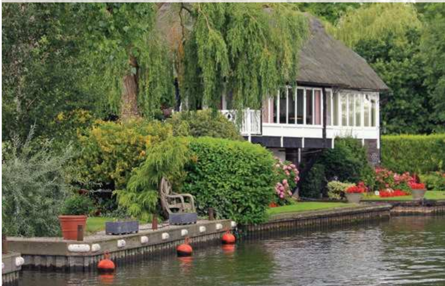
Sur les rives des Norfolk Broads...

Les vacances en bateau sont ancrées dans les traditions des Norfolk Broads, la plus grande réserve naturelle du Royaume-Uni.