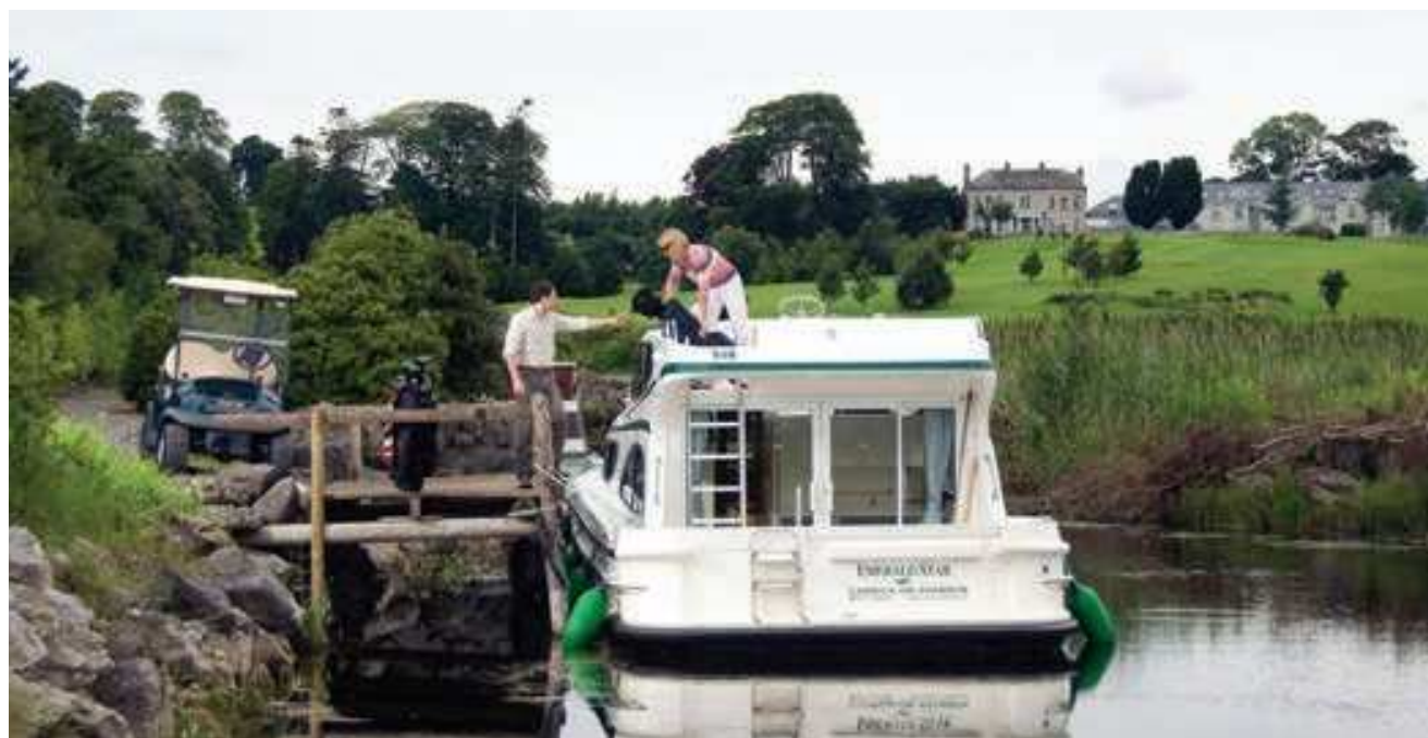
Golf en Irlande

Périple royal, paysages spectaculaires et réserve naturelle exceptionnelle !