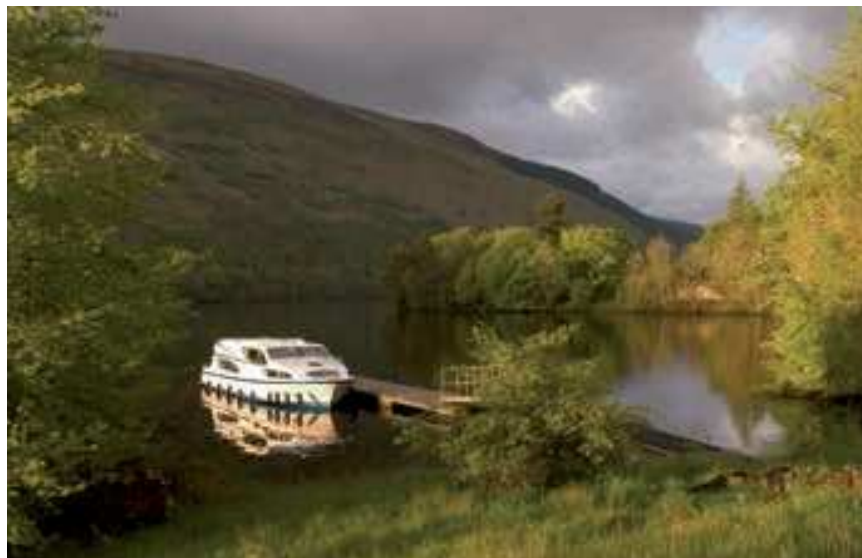
La campagne écossaise

Bienvenue en Ecosse dans les paysages grandioses des Highlands où les landes de bruyère se parent de couleurs surnaturelles. Entouré de magnifiques montagnes et coteaux argentés, le Canal Calédonien s'étire depuis la capitale des Highlands, Inverness, pour se terminer à Fort William au Sud en passant par