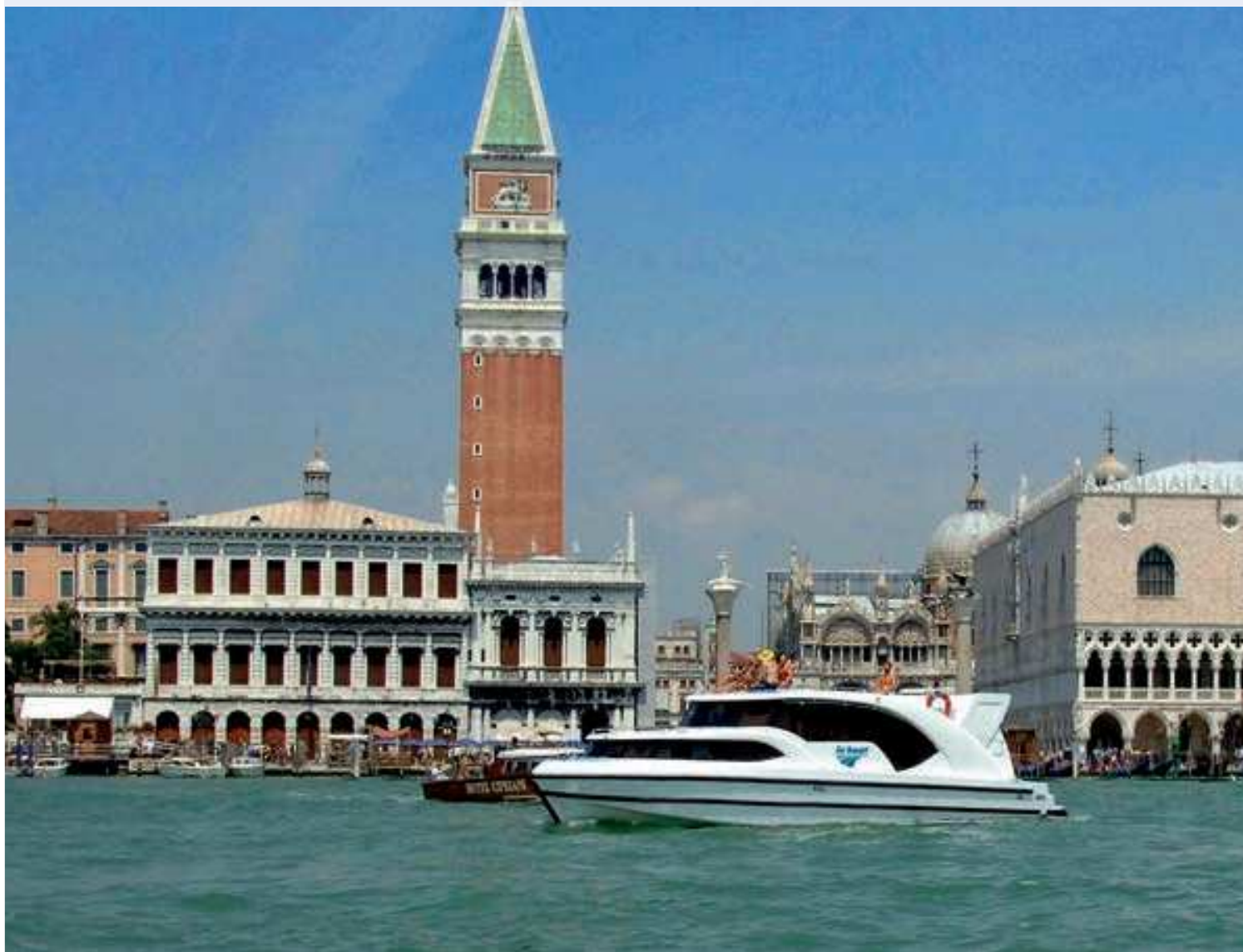
Place St Marc, Lagune de Venise

Découvrez les couleurs et féeries Vénitiennes