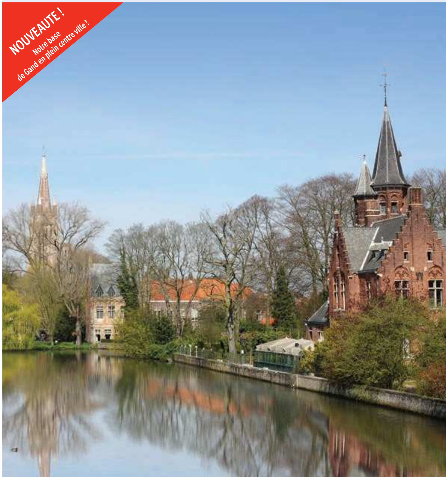
Les voies navigables de Brugges

NOUVEAUTE ! Notre base de Gand en plein centre ville !