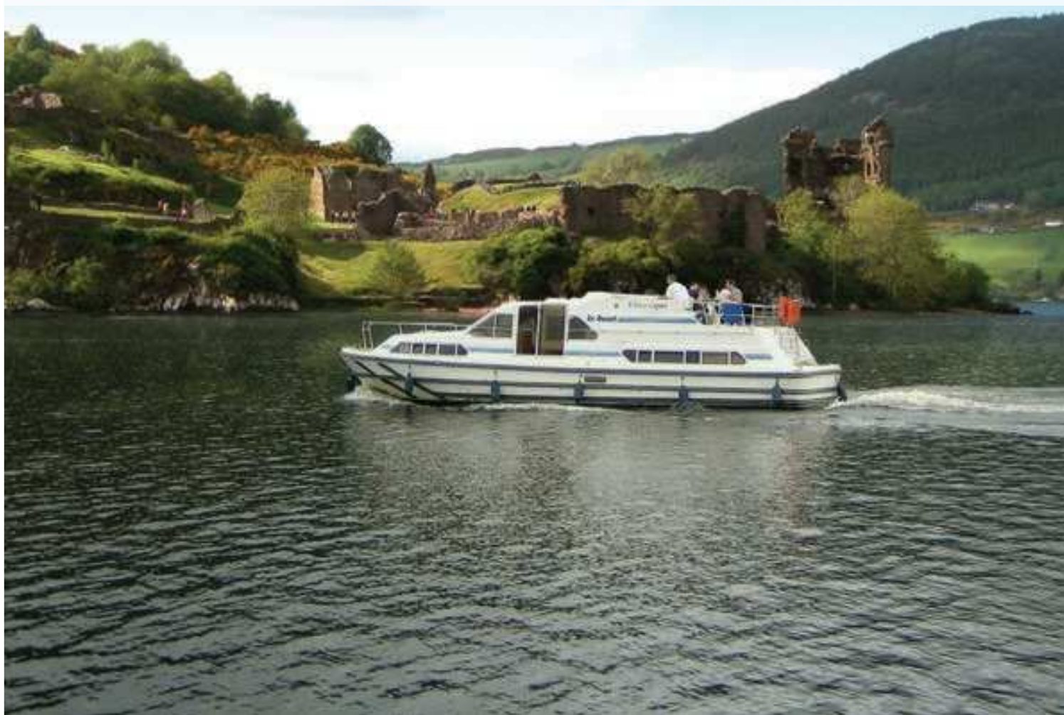
Navigation sur un loch en Ecosse

Préparez-vous à une croisière magique jusqu'au vaste Loch Ness dont les fonds abritent Nessie, le plus célèbre des monstres, puis parmi les îlots du Loch Oich et enfin sur le sauvage Loch Lochy, dominé par le Ben Nevis, le plus haut sommet d'Ecosse. En route, admirez le panorama du Loch Oich et profitez des activités nautiques du Great Glen Water Park. Découvrez les traditions des Highlands au Centre Clansman de Fort Augustus, l'un des villages les plus typiques sur votre route. Passez voir "Nessie" en traversant le Loch Ness et visitez Drumnadrochit, centre d'observation du monstre et point de départ de belles randonnées à cheval. Visitez le Château de Urquhart sur les rives du Loch Ness et passez un peu de temps à Inverness où vous pourrez apercevoir des dauphins et faire fabriquer votre propre kilt ! De retour via Gairloch et l'échelle d'écluses de Neptune à Banavie, vous pourrez profiter d'une vue spectaculaire sur l'Océan Atlantique et sur Fort William. Vous trouverez un peu partout des haltes nautiques où vous pourrez pratiquer canôe, planche à voile ou encore ski nautique. A terre,