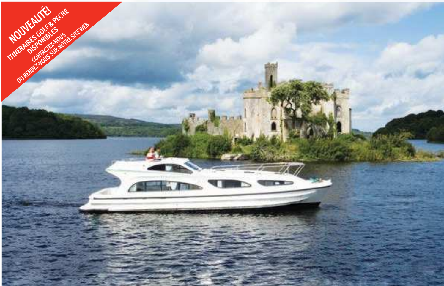
Château Lough Key Island

NOUVEAUTÉ! ITINÉRAIRES GOLF & PÊCHE DISPONIBLES CONTACTEZ-NOUS OU RENDEZ-VOUS SUR NOTRE SITE WEB