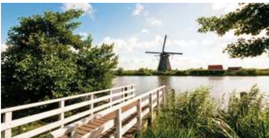
Moulins à vent en Hollande

Vous adorerez les voies navigables hollandaises!