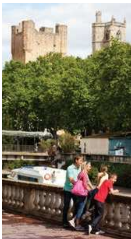
La ville romaine de Narbonne