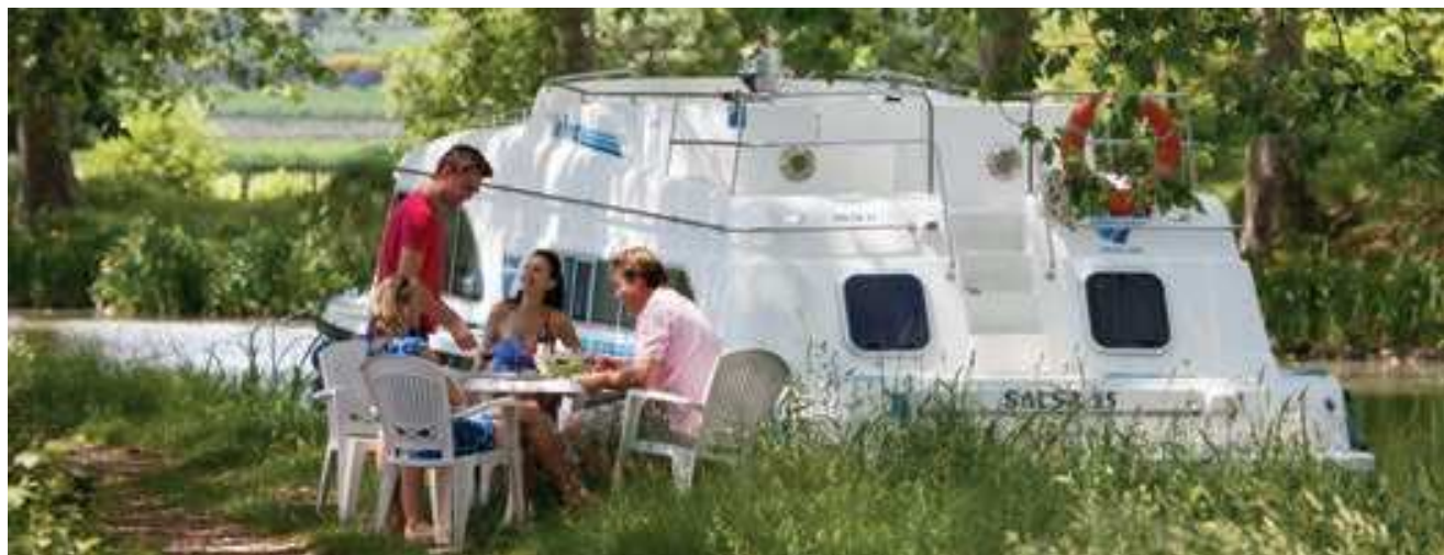
Pause pique-nique le long du canal

Naviguez en Alsace et découvrez une nature préservée et un patrimoine architectural d'exception. Une croisière en Alsace vous fera découvrir une culture riche et cosmopolite.