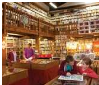
La boutique de livres anciens au Somail