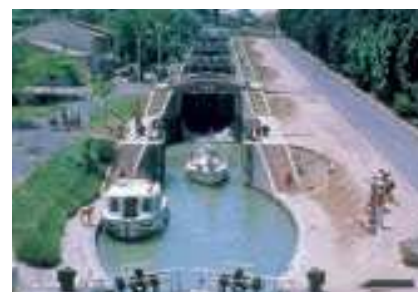
Les écluses de Fonsérannes

Le Canal du Midi traverse la jolie région du Languedoc Roussillon jusqu'à la Cité médiévale de Carcassonne classée au Patrimoine Mondial de l'Unesco et qui a inspiré l'un des grands classiques de Walt Disney, la Belle aux Bois dormant. Visitez Castelnaudary et dégustez le fameux et mondialement connu Cassoulet. L'ancienne cité romaine de Narbonne vous surprendra avec sa magnifique cathédrale Gothique, ses musées et ses plages. Le Somail, avec sa boutique de livres anciens est l'endroit idéal pour une étape avant de découvrir la cité cathare d'Argens Minervois. Les petites villes portuaires de Trèbes, Homps, Ventenac et Capetang disposent d'excellents restaurants, de boutiques mais également de caves pour déguster les vins de Corbières et de Minervois.