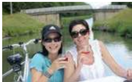
Le plaisir de déguster un verre de vin