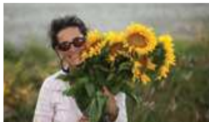
Champs de tournesols, Canal du Midi

Naviguer dans le Lot procure des sensations inoubliables ! Au cœur d'une nature sauvage et préservée, naviguez au pied de falaises vertigineuses...et profitez des eaux claires de la rivière pour une baignade ou une escapade en canoë-kayak.