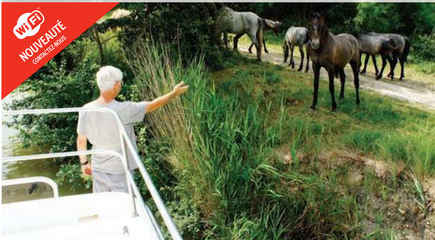
Chevaux sauvages en Camargue

Aucune autre région de France n'offre une telle diversité de traditions, de vie sauvage et de paysages. La Camargue, avec ses traditions colorées, ses ports animés et ses plages de sable fin vous accueillera dans une ambiance chaleureuse. A cheval, en quad, à buggy ou en jet ski, explorez cette magnifique région comme bon vous semble ! Avec un taux d'ensoleillement exceptionnel toute l'année, vous pourrez profiter d'une croisière en Camargue dès le mois d'Avril jusqu'à fin Octobre. Au départ de Port Cassafières, vous naviguerez vers l'étang de Thau et votre première escale sera Agde, une des plus anciennes villes de France, riche de son histoire maritime, où vous pourrez admirer en plein été les tournois de joutes. Dégustez ensuite de délicieuses huîtres à Bouzigues avant de vous amarrer dans un des jolis villages de pêcheurs à Mèze ou Frontignan, célèbres pour leurs fameux apéritifs. Vous pourrez également vous détendre sur les plages de Palavas les-Flots, La Grande Motte et Carnon. Visitez les caves AOC Costières de Nîmes à Gallician avant de vous amarrer devant la cité fortifiée d'Aigues Mortes. Vous pourrez finalement observer une faune et une flore fantastique au cœur des étangs Camargais.