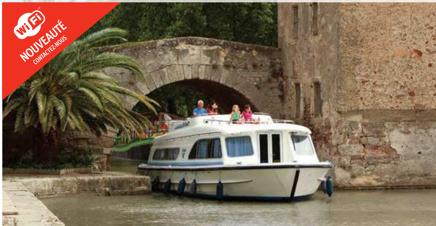
Navigation au Somail