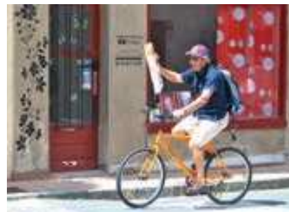
Balade à vélo

En Bourgogne , vous découvrirez une histoire prestigieuse, un patrimoine architectural exceptionnel et une cuisine raffinée ! Nos deux régions de croisière,