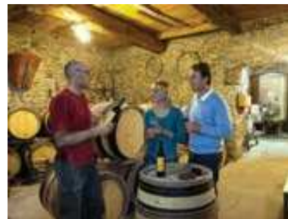
Domaine des Mael, Argens Minervois